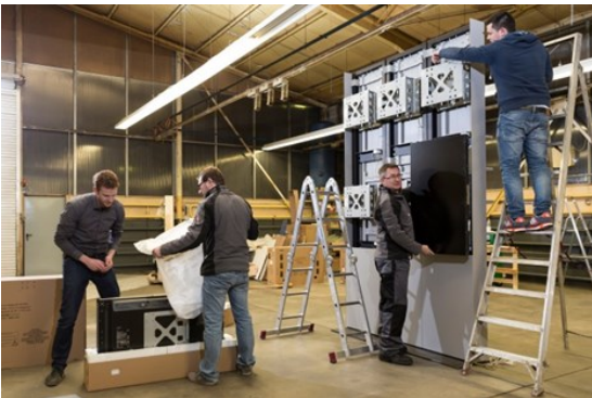
Teamwork beim Zusammenbau der VideoWall.