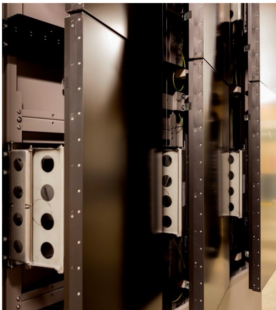
Wandhalter mit "snap-in and push-out" System.