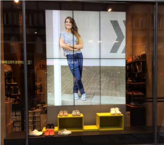
DigitalSignage im Ladengeschäft beim Endkunden.